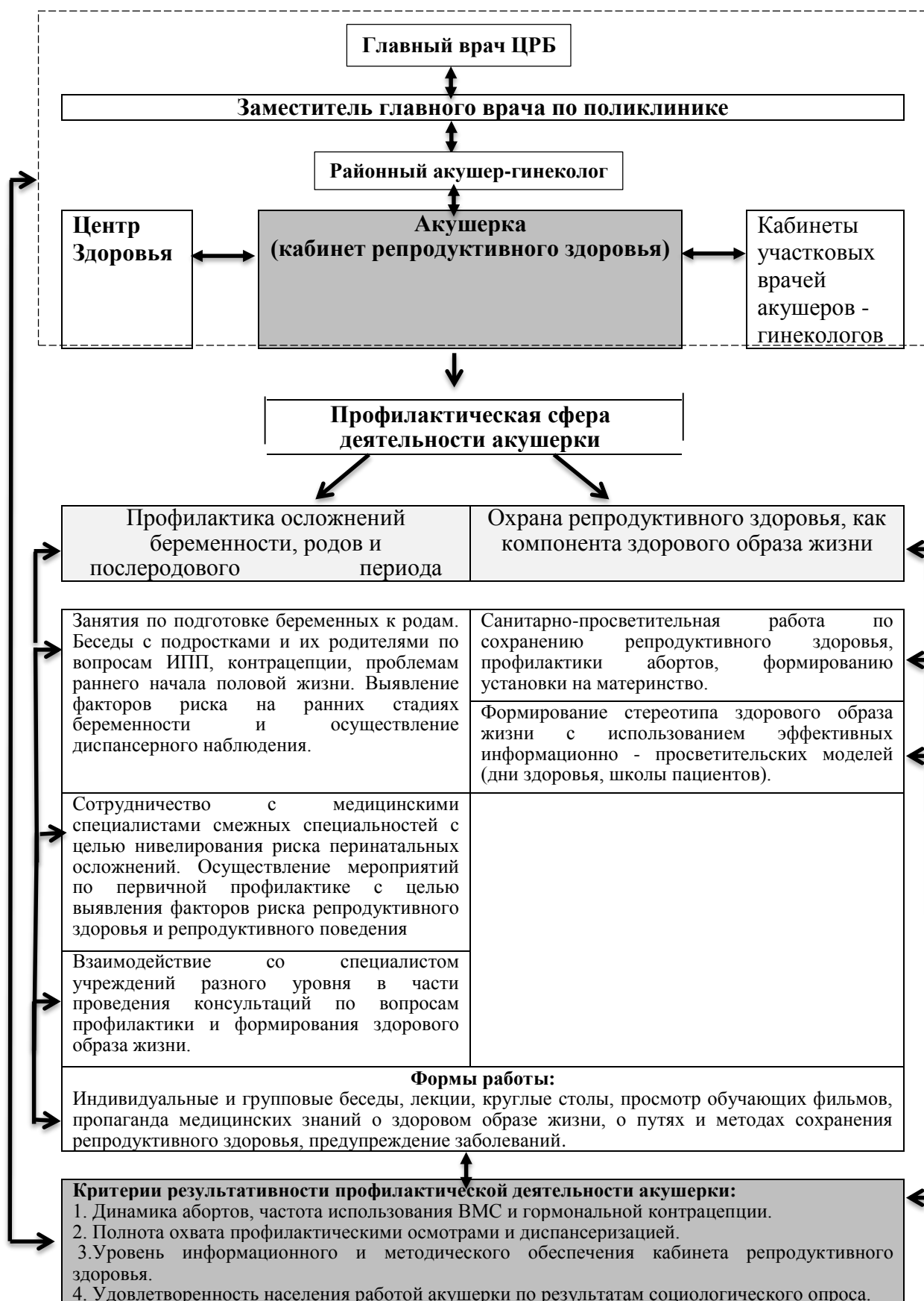
Рисунок 1. Модель профилактической деятельности акушерки.