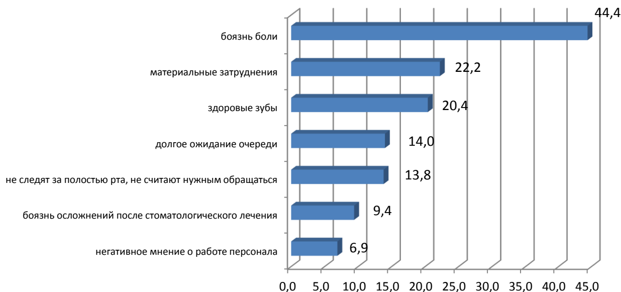
Рисунок 1. Причины, сдерживающие обращение взрослого населения в стоматологическую поликлинику (на 100 опрошенных)

Важнейшим фактором несвоевременного оказания медицинской помощи является наличие причин, по которым население откладывает обращение к стоматологу. Как показал опрос (рисунок 1), 44,1 \pm 2,1 % респондентов указали на боязнь боли, что свидетельствует об их представлении о применяемых лечебных технологиях.