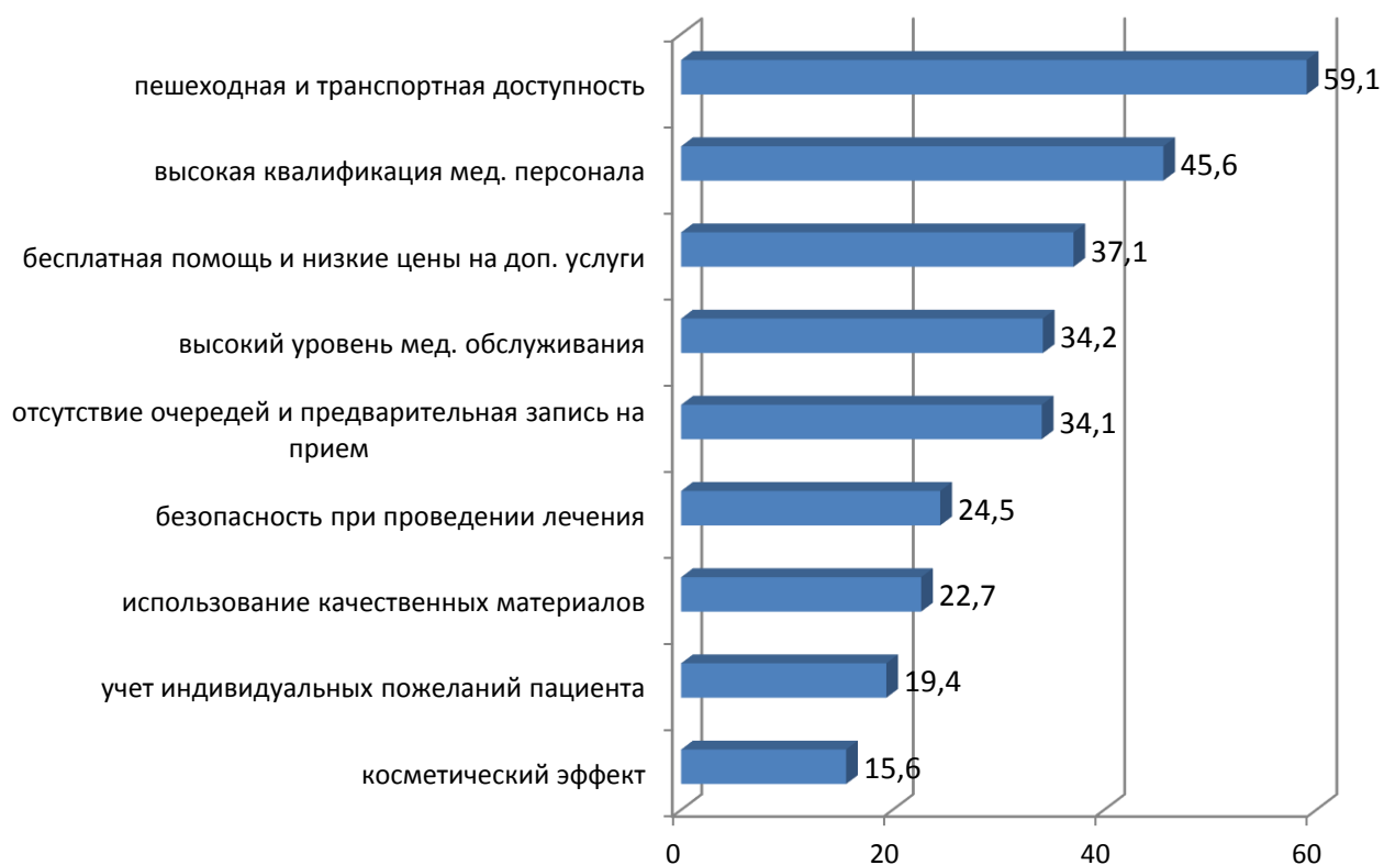
Рисунок 2. Факторы, способствующие обращению взрослого населения в данную поликлинику (на 100 опрошенных)

Одним из значимых условий успешной деятельности поликлиники является ее привлекательность для населения. Изучение мнения пациентов показало (рисунок 2), что ведущими мотивами их обращения в данную поликлинику обусловлено в 45,6 \pm 2,1 % случаев высокой квалификацией врачей и в 34,2 \pm 2,3 % – достаточным уровнем медицинского обслуживания. При этом респонденты положительно оценивали учет врачами их индивидуальных пожеланий ( 19,4 \pm 2,5 %) и безопасное проведение стоматологических процедур ( 24,5 \pm 2,4 %).