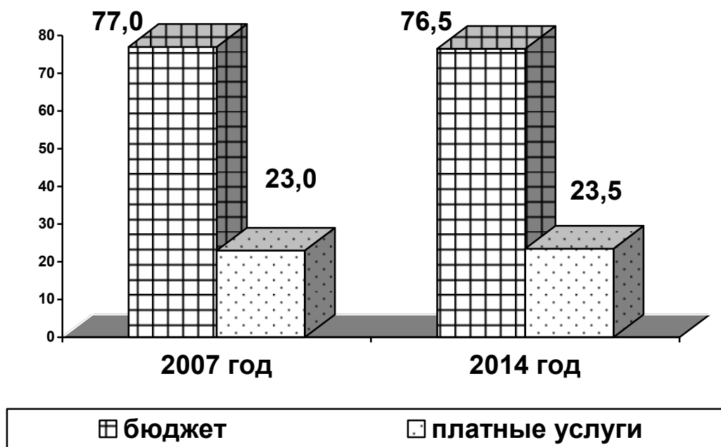
Рисунок 2. Структура финансовых источников наркологической помощи Костромской области (в % без учета субсидий из федерального бюджета)

Структура финансовых источников наркологической помощи Костромской области представлена на рисунке 2.